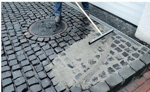
Fugenmörtel mit Gummischaber einwischen