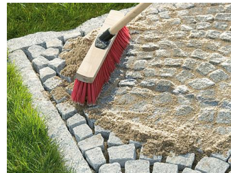
Brechsand mit Stossbesen einwischen